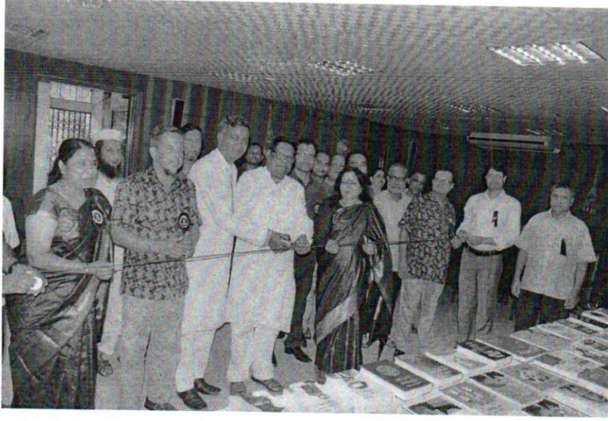
জাতীয় শোক দিবস উপলক্ষে জাতীয় গ্রন্থকেন্দ্রের উদ্যোগে 'বঙ্গবন্ধু ও মুক্তিযুদ্ধ' বিষয়ক গ্রন্থ প্রদর্শনীর আয়োজন