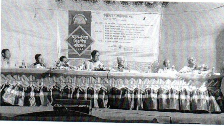
ময়মনসিংহ বিভাগীয় বইমেলা ২০১৯-এর উদ্বোধনী অনুষ্ঠানে সংস্কৃতি প্রতিমন্ত্রী জনাব কে এম খালিদ, এমপিসহ অন্যান্য অতিথি

ময়মনসিংহ বিভাগীয় বইমেলা : সংস্কৃতি বিষয়ক মন্ত্রণালয়ের পৃষ্ঠপোষকতায় জাতীয় গ্রন্থকেন্দ্রের উদ্যোগে এবং ময়মনসিংহ জেলা প্রশাসনের ব্যবস্থাপনায় বাংলাদেশ জ্ঞান ও সৃজনশীল প্রকাশক সমিতি এবং বাংলাদেশ পুস্তক প্রকাশক ও বিক্রেতা সমিতির অংশগ্রহণে ২৫-৩০ মার্চ ২০১৯ তারিখ পর্যন্ত ০৭ (সাত) দিনব্যাপী ময়মনসিংহ বিভাগীয় বইমেলা ময়মনসিংহ টাউন হল মাঠে অনুষ্ঠিত হয়। উক্ত বইমেলা উদ্বোধন করেন সংস্কৃতি বিষয়ক মন্ত্রণালয়ের মাননীয় প্রতিমন্ত্রী জনাব কে এম খালিদ, এমপি।