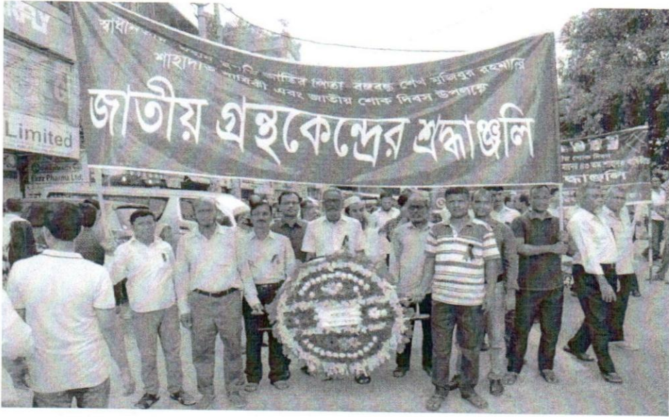
জাতীয় শোক দিবস উপলক্ষে বঙ্গবন্ধুর প্রতিকৃতিতে পুষ্পার্ঘ্য অর্পণ

জাতীয় গ্রন্থকেন্দ্র প্রতিবছরই বিভিন্ন দিবসগুলো যথাযোগ্য মর্যাদায় পালন করে থাকে। জাতির পিতা বঙ্গবন্ধু শেখ মুজিবুর রহমানের শাহাদাৎ বার্ষিকী ও জাতীয় শোক দিবস উপলক্ষে বঙ্গবন্ধুর প্রতিকৃতিতে পুষ্পার্ঘ্য অর্পণ করে শ্রদ্ধা নিবেদন করা হয়। দিবসটি পালনের অংশ হিসেবে জাতীয় গ্রন্থকেন্দ্রের উদ্যোগে 'বঙ্গবন্ধু ও মুক্তিযুদ্ধ' বিষয়ক গ্রন্থ প্রদর্শনীর আয়োজন করা হয়।